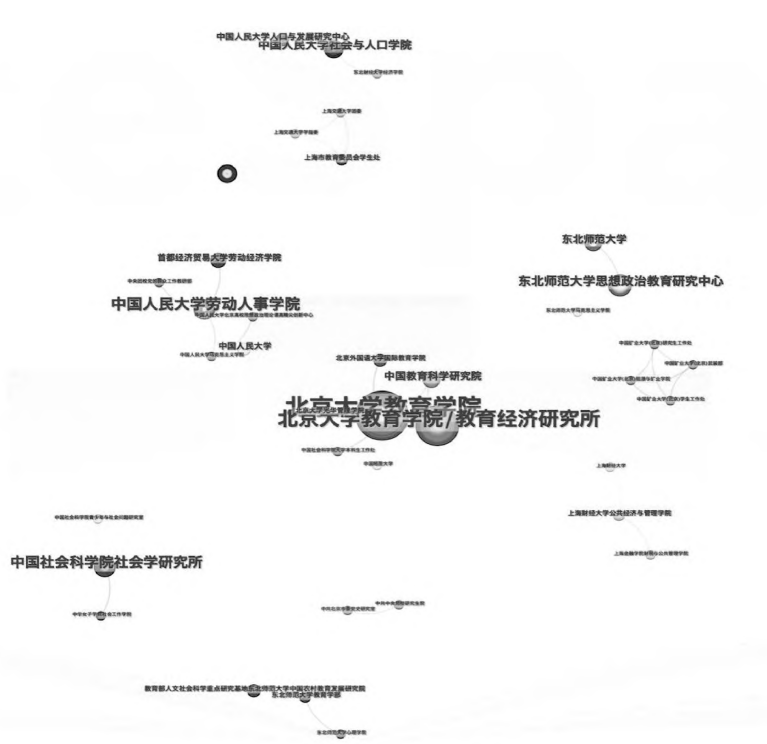
图3 青年就业研究机构合作网络

型设置为 Institution, 时间段为 2000—2023 年, 时间切片为 1, 阈值选择为 g-index k=20 , 得到青年就业研究领域的机构合作网络图谱(见图 3)。从机构合作图谱中可以看出, 北京大学教育学院是图谱中节点最大的机构, 也是青年就业领域产出最高的研究机构。除以北京大学教育学院为中心包括中国教育科学研究院等机构在内的合作网络外, 也形成了以中国人民大学劳动人事学院为中心包括首都经济贸易大学劳动经济学院等机构, 以东北师范大学教育学部为中心包括东北师范大学心理学院等